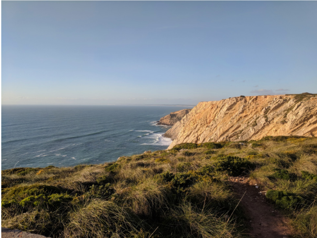
Kuva 2. Cabo Espichelin kielekkeet