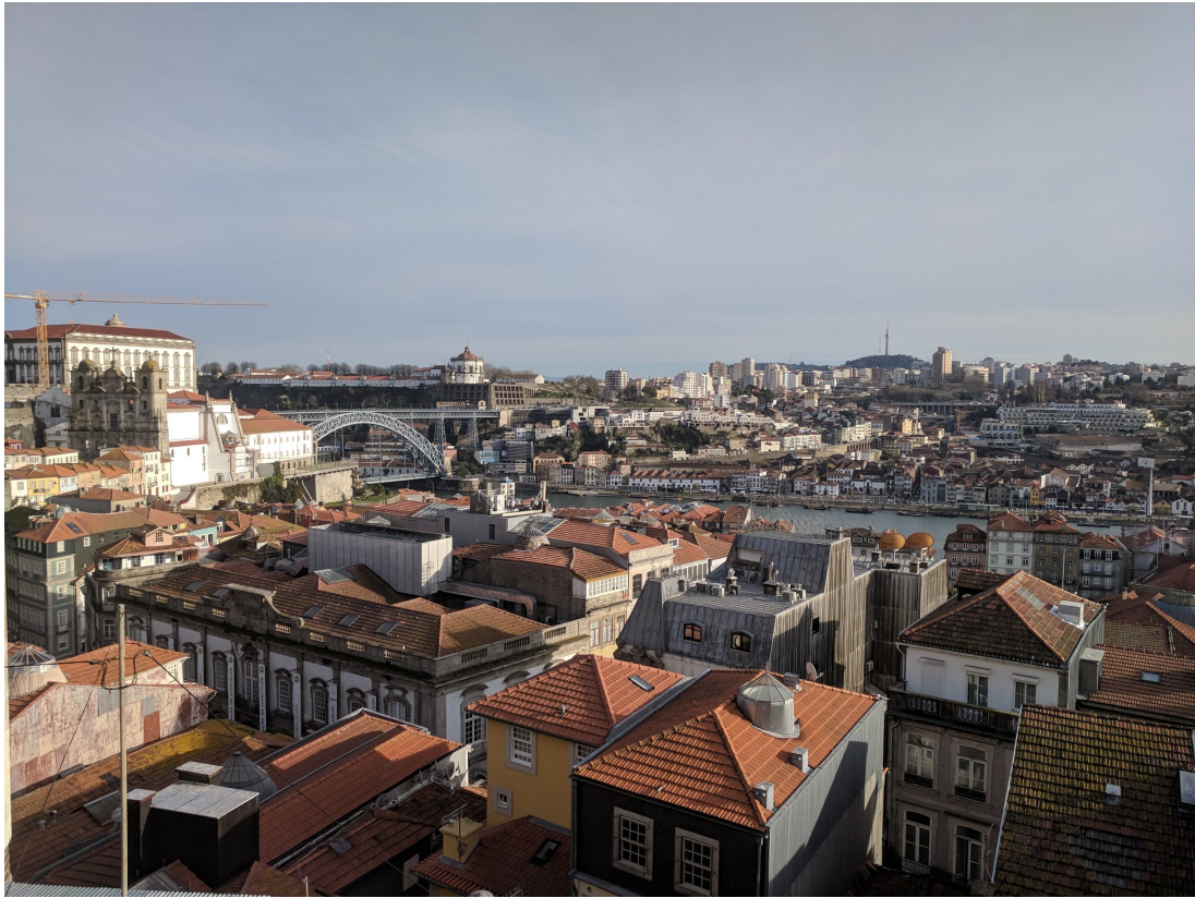
Kuva 3. Porto on yksi maailman kauneimmista kaupungeista